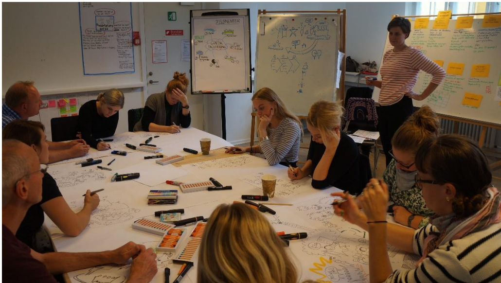
Foto: Lær at bruge grafisk facilitering