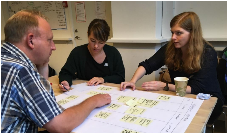
Foto: Del din case i peer-trios, med andre deltagere med lignende cases