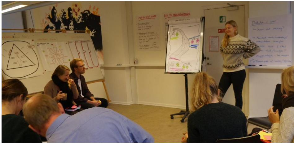
Foto: Afprøv dine nye værktøjer og få feedback på din facilitering.